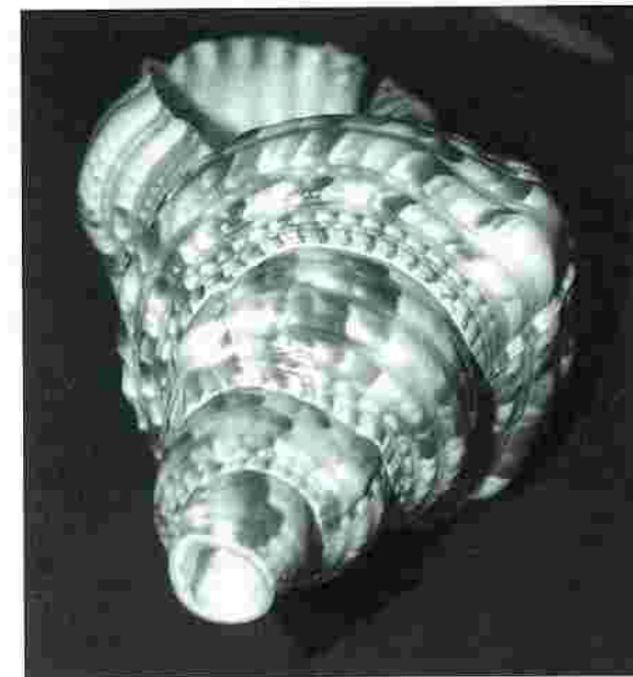
Tritonium nodiferum Lumaga de mae

Altri oggetti sonori utilizzati più per fare segnalazioni che per fare musica erano il corno bovino e la conchiglia di mare (tritonium nodiferum), Lumaga de mae , di origine esotica, che sui velieri veniva usata come sirena (foghorn). Una volta diffusasi in montagna, suonandola si espletavano varie funzioni: avvertire le stalle per il ritiro del latte, oppure per chiamare qualcuno a lunga distanza, ad esempio il medico condotto, (un esemplare si può vedere nel museo contadino di Cassego). Sia in Lunigiana che in Val di Vara, erano presenti poi, strumenti in legno e ferro a sbattimento e a raschiamento (raganelle, batuelle), che venivano utilizzati durante i riti della settimana santa, quando le campane venivano legate, oppure in occasione di qualche